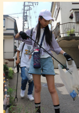
旭区学家地事業では、地域におけるごみ拾い活動も行われています