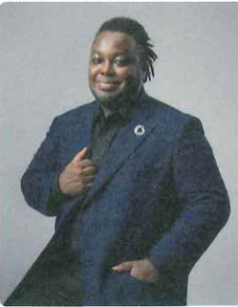
Special Live クリス・ハート