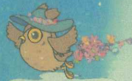
瀬谷区マスコットキャラクター 「せやまる」

開催2年前を記念して、GREEN×EXPO 2027の開催テーマである「花、農、環境」など子どもから大人まで楽しく参加できるイベントを実施します。