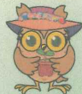
せやまるの妹「このは」

区内の小学校10校の小学6年生の皆さんが、GREEN×EXPO 2027が開催される2年後の自分に向けて書いたメッセージを集めて、アジサイのボードを作成しました。ぜひご覧ください。