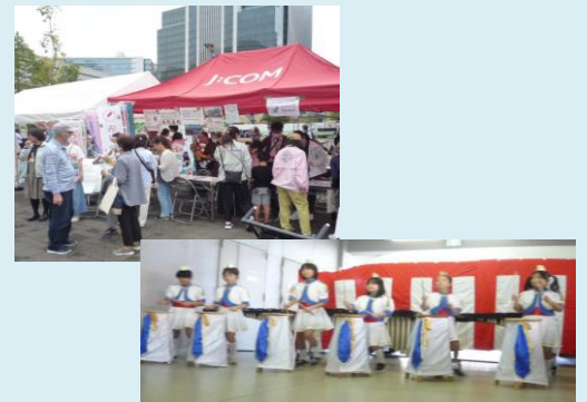
《令和6年度にこまち助成金を活用した活動をご紹介します》

上：みなとみらい秋祭り実行委員会「みなとみらい秋祭り」 下：平沼マーチングバンド「戸部ケアまつり」での演奏