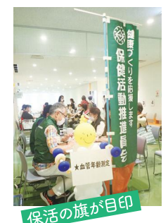
保活の旗が目印 歯と口の健康週間イベントでの健康チェックの様子