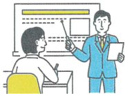
調査員説明会に参加