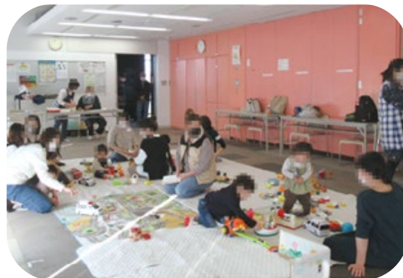
地域の親子の居場所「子育てサロン」