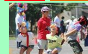
ふれあいスポーツまつり