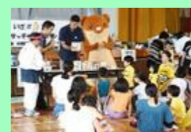
タッチーキャラバン