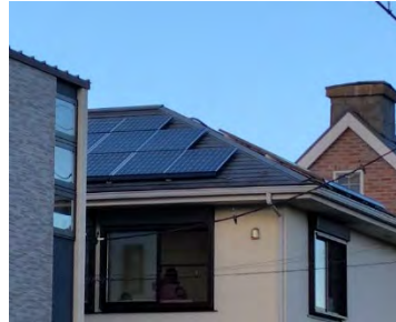
↑太陽光パネルの設置