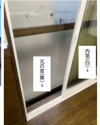
↑窓の断熱化（内窓の設置）