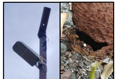
ポールの劣化事例

自治会町内会から移管された 鋼管ポール型防犯灯は、設置から年数が経ったものも多く、劣化の著しいものも見られます 。倒壊による被害を防止するためにも、 見守り活動等により劣化したポールを発見した場合は、速やかな情報提供をお願い します。