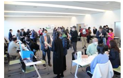
▲事業者ブースで説明を受ける自治会町内会の様子