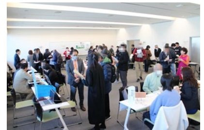
▲事業者ブースで説明を受ける自治会町内会の様子