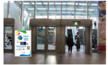
〈カウンタダウンボード 設置イメージ〉