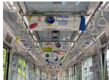
〈車内広告イメージ〉