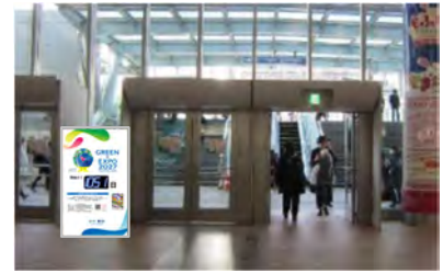
〈カウンタダウンボード 設置イメージ〉