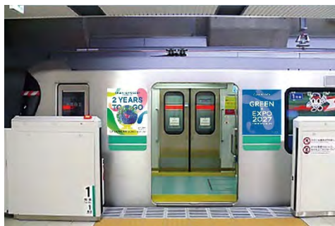
〈横浜市営地下鉄車体広告イメージ〉