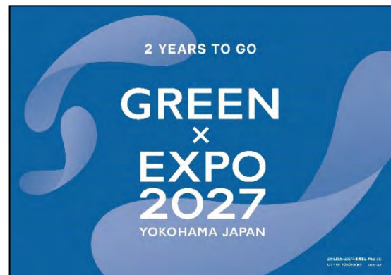
〈開催2年前限定デザイン〉