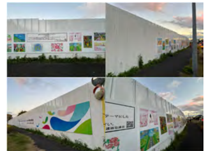
〈仮囲い 装飾イメージ〉