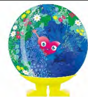
公式マスコットキャラクター 「トウクトウク」

開催場所 : 神奈川県横浜市（旧上瀬谷通信施設） 開催期間 : 2027年3月19日（金）～ 2027年9月26日（日） テーマ : 幸せを創る明日の風景 ～Scenery of the Future for Happiness～ 博覧会区域 : 約100ha（内、会場区域80ha） クラス : A1（最上位）クラス（AIPH承認＋BIE認定） 参加者数 : 1500万人（有料来場者数：1,000万人以上）