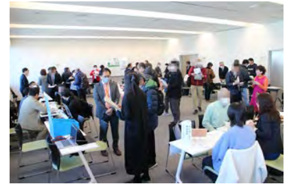
▲事業者ブースで説明を受ける自治会町内会の様子