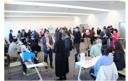
▲事業者ブースで説明を受ける自治会町内会の様子