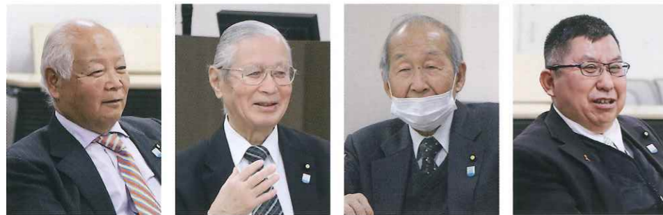
高岩会長 堀野会長 大柴会長 須藤会長