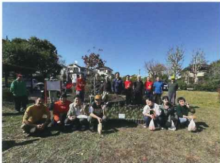
横浜瀬谷ロータリークラブ 阿久和大久保原公園

オリジナルの花壇用プレートも掲示して、園芸博をPR！ たくさんの素敵な花壇が瀬谷を彩っています。