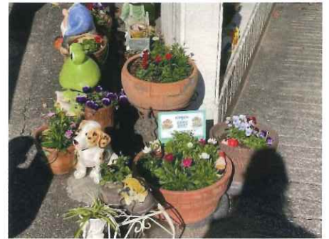
下瀬谷地域ケアプラザ