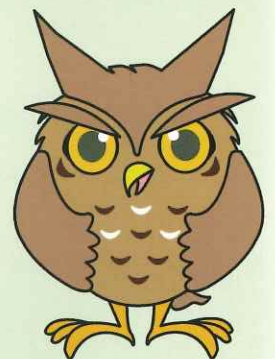
せやまるのおとうさん

連合では、多くの人を楽しめる大規模なレク大会などの開催や、エリア全体の課題解決のための取組を行っているよ。