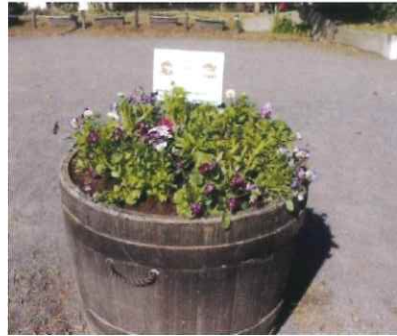
三ツ境公園内花壇