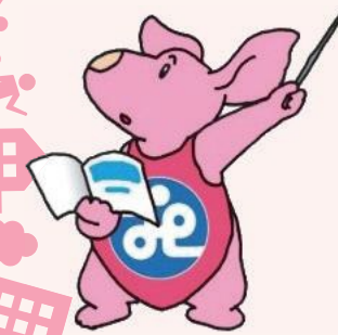
南区社会福祉協議会 マスコットキャラクター トモニー