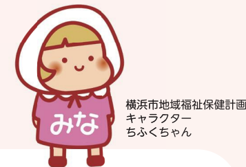
横浜市地域福祉保健計画 キャラクター ちふくちゃん