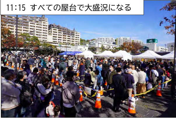
11:15 すべての屋台で大盛況になる