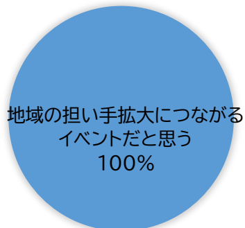
名人育成講座の受講者