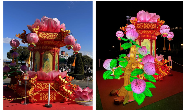
昼間と夜の様子（2025年・山下公園会場）

祝祭に欠かせないランタンオブジェは、職人が一つひとつ手作業でつくる中国伝統工芸で、色鮮やかでやさしい灯のイルミネーションです。小さなものでも高さ約2m、大きなものは高さ5mや幅9mもあり迫力満点！写真映えもするのでSNSでも大人気です。2026年は、横浜中華街のほか、横浜ベイエリアを中心に57会場で展開し、スタンプを集めると景品として、「春節グッズ」がもらえる春節デジタルスタンプラリーも実施します。ランタンオブジェは、1月上旬から随時設置をし、一部会場を除き2026年1月20日から展示します。