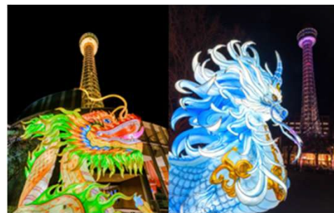
昨年度のW春節ライトアップの様子