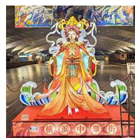
横浜媽祖廟と媽祖様のランタンオブジェ