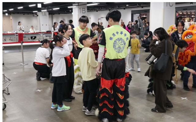
昨年度の子ども獅子舞ワークショップの様子