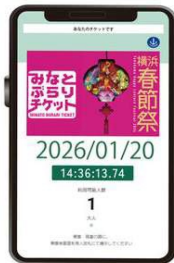
チケットイメージ （左：アナログチケット、右：デジタルチケット）