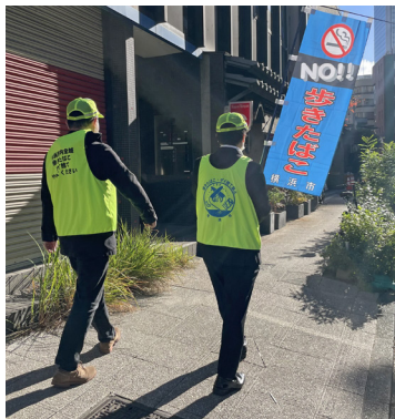
パトロールの様子