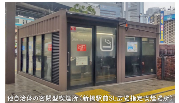
他自治体の密閉型喫煙所(新橋駅前SL広場指定喫煙場所)