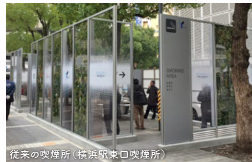
従来の喫煙所(横浜駅東口喫煙所)

喫煙所への案内・誘導や、喫煙禁止地区の既存喫煙所を密閉化するなど喫煙所の整備を進めます。