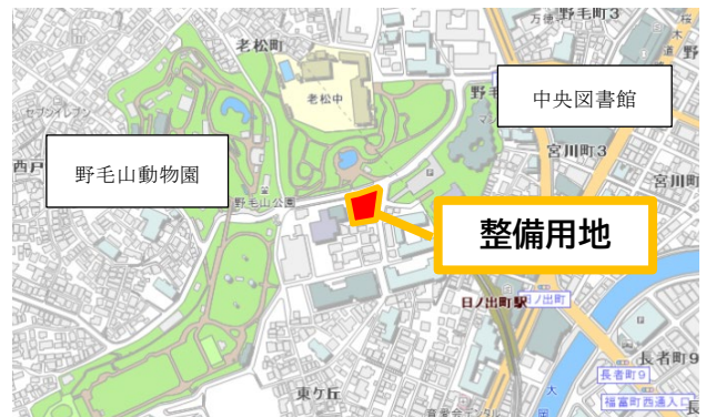
【所在地】西区老松町 25-3 ほか