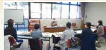
本の修理ステップアップ講座の様子