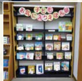
絵本サポーターとの連携企画