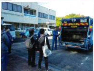
★プレパーク栄（資源循環局）の見学