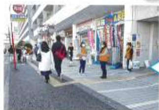
★路上キャンペーン