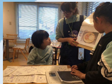
環境にやさしい簡単なひと手間を学習