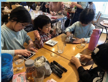
水の力でお掃除体験