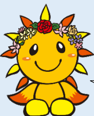
旭区マスコットキャラクター あさひくん