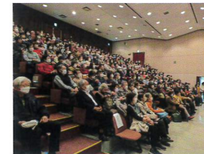
2026年3月4日(水) 主催 旭公会堂自主事業 上映会「九十歳。何がめでたい」 共催 旭区更生保護女性会 旭保護司会 旭区社会福祉協議会