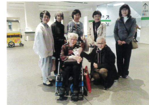
2025年11月26日(水) 第76回神奈川県更生保護大会 カルッツかわさき