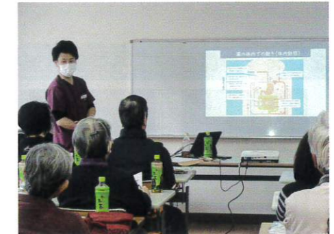
2025年度ミニ集会 若葉台 / 上白根、旭北合同 / 今宿 希望が丘3地区、笹野台 / 万騎が原 / 川井