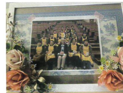
旭区更生保護女性会理事