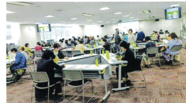
2025年10月17日(金) 新会員研修 保護観察所