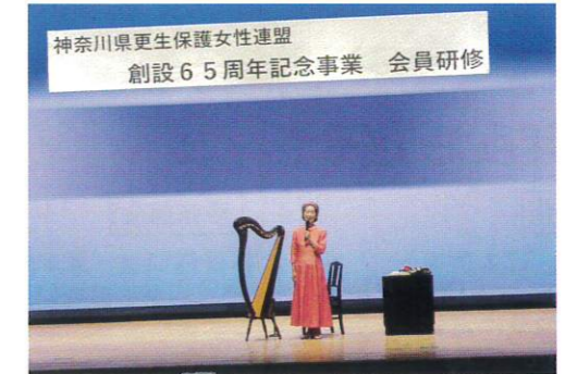
2025年12月15日(月) 県更女創立65周年記念事業会員研修 西公会堂