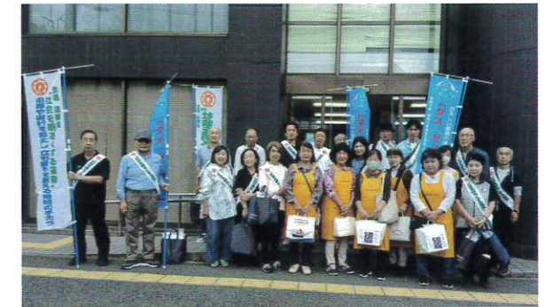
2025年10月19日(日) 第35回旭ふれあい区民まつり 旭区役所他