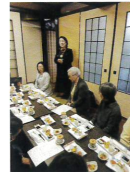
2026年1月9日(金) 旭区更女賀詞交歓会 鶴ヶ峰南房