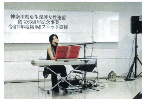
2025年10月7日(火) Bブロック研修 栄区役所