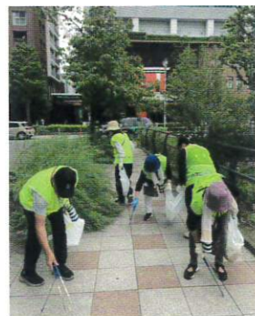
2025年10月3日(金) 社会貢献活動 みなとみらい清掃 旭保護司会、旭区更女参加