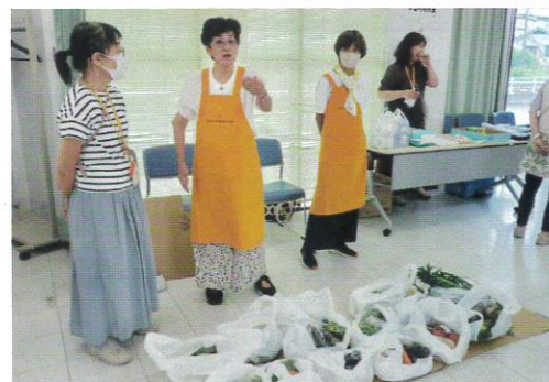
2025年7月5日(土)、12月6日(土) ひとり親家庭応援Day ぱれっと旭