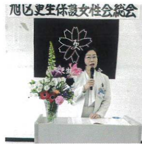
2025年4月25日(金) 令和6年度旭区更生保護女性会総会 ぱれっと旭