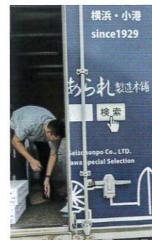
2025年9月29日(月) 愛のあられ、ビスケット配達 旭区全域