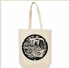
戸塚区駅伝マンホールバック