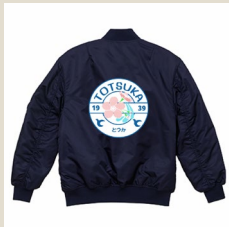
戸塚区オリジナルMA-1

上記以外にも、グルメや高級食器等 横浜ならではの お礼の品も お選びいただけます。