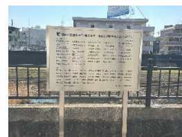
令和7年 寄附者御芳名板