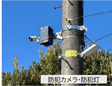
防犯カメラ・防犯灯