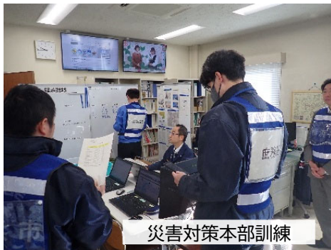
災害対策本部訓練