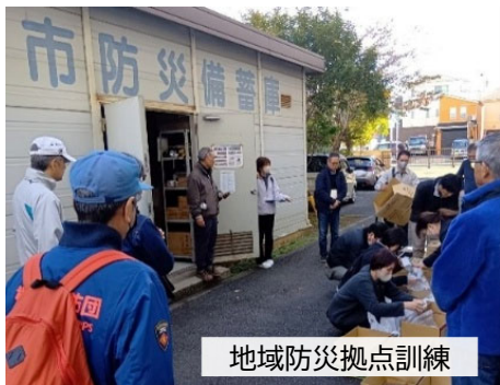
地域防災拠点訓練