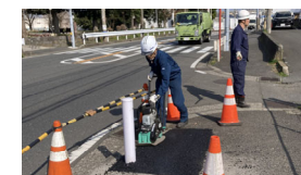
生活インフラの維持管理