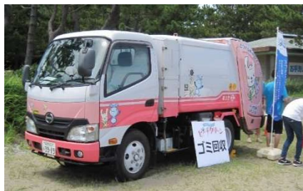
【ビーチクリーンゴミ回収車】