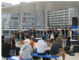
[ストリートライブ]