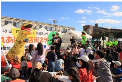
[戸塚ふれあい区民まつり]

人と人とのつながりを大切に、「第5期とつかハートプラン(戸塚区地域福祉保健計画)」を区民の皆様と共に推進し、子育て支援などの福祉保健分野をはじめ、地域の多岐にわたる活動を支援します。また、防災・防犯に全力で取り組み、誰もが安心して暮らせるまちづくりを進めます。