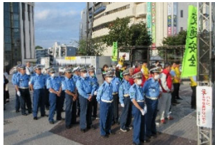
【秋の交通安全キャンペーン】