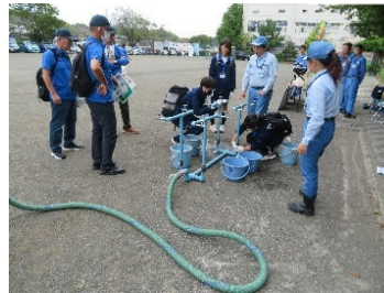
[中高生の応急給水訓練]