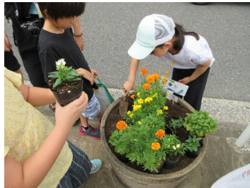
[小学校での花植え]