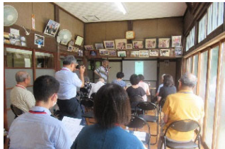
【スマホ相談室(谷矢部東町内会)】