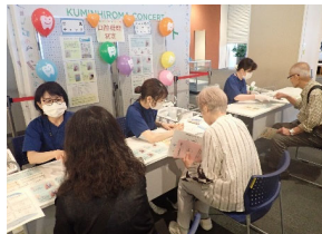
[わくわく健康フェア]