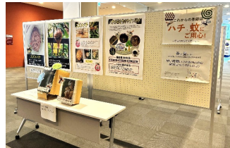
【ハチ早期駆除等啓発展】