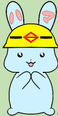
横浜市防災・危機管理X公式キャラクター ハマらび