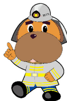
横浜市消防局マスコットキャラクターハまくん