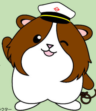
横浜市防災・危機管理X公式キャラクター みなモル