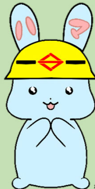
横浜市防災・危機管理X公式キャラクター ハマらび