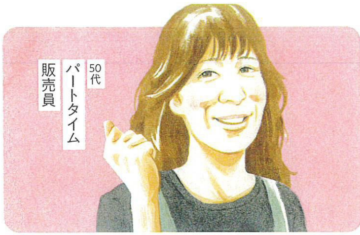
50代 パートタイム 販売員