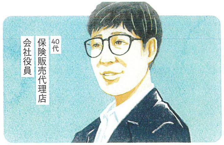
40代 保険販売代理店 会社役員