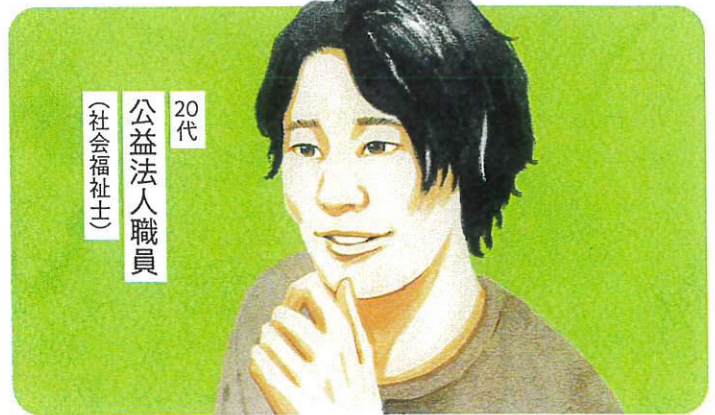
20代 公益法人職員 (社会福祉士)