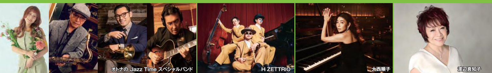
オトナの Jazz Time スペシャルバンド